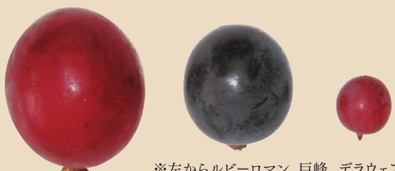
※左からルビーロマン、巨峰、デラウェア

巨峰の約2倍の大きさで、鮮やかな赤色をしたルビーロマンは、初競りの最高値が9年連続で100万円を超え高い評価を得ているなど、ぶどうの最高級ブランドと言っても過言ではありません。大きさが甘さなど厳しい規格を満たしたものが、ルビーロマンとして出荷されています。